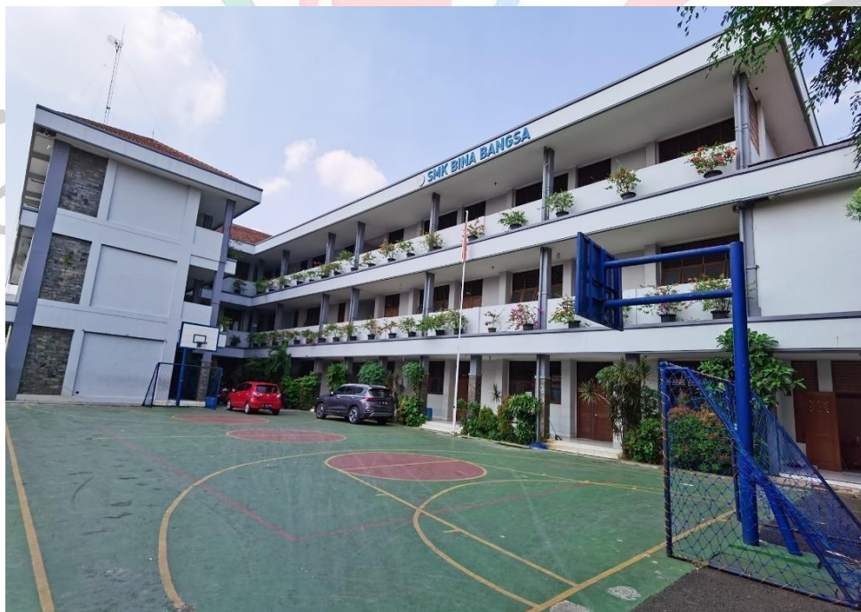
Gambar 1.1 SMK Bina Bangsa