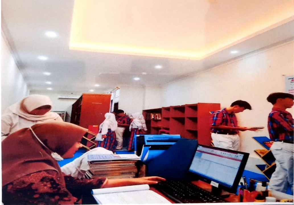
Lampiran 2.1 Praktikan Saat Melakukan Kerja Profesi