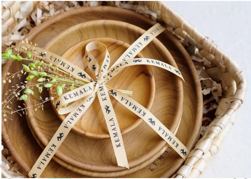
Gambar 2.14 Plate Hampers