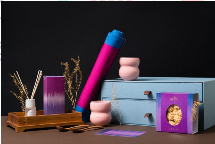
Gambar 2.11 led Hampers