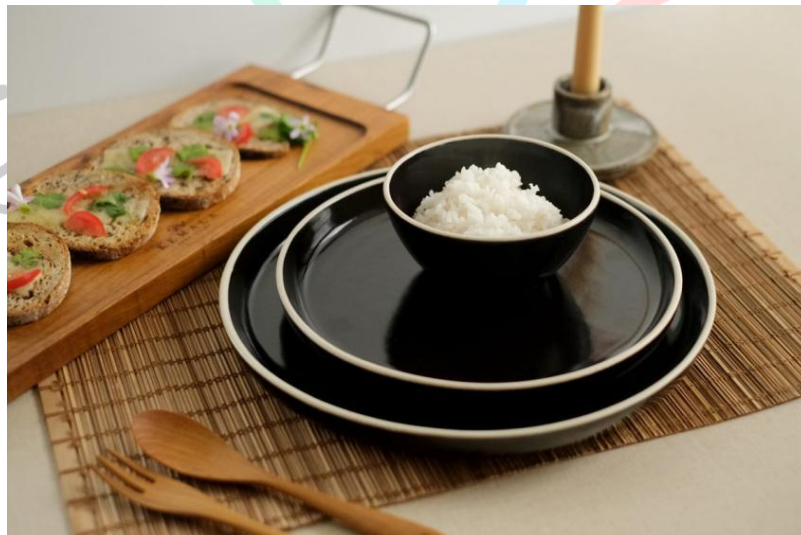
Gambar 2.5 Ceramic Noir Plate & Bowl