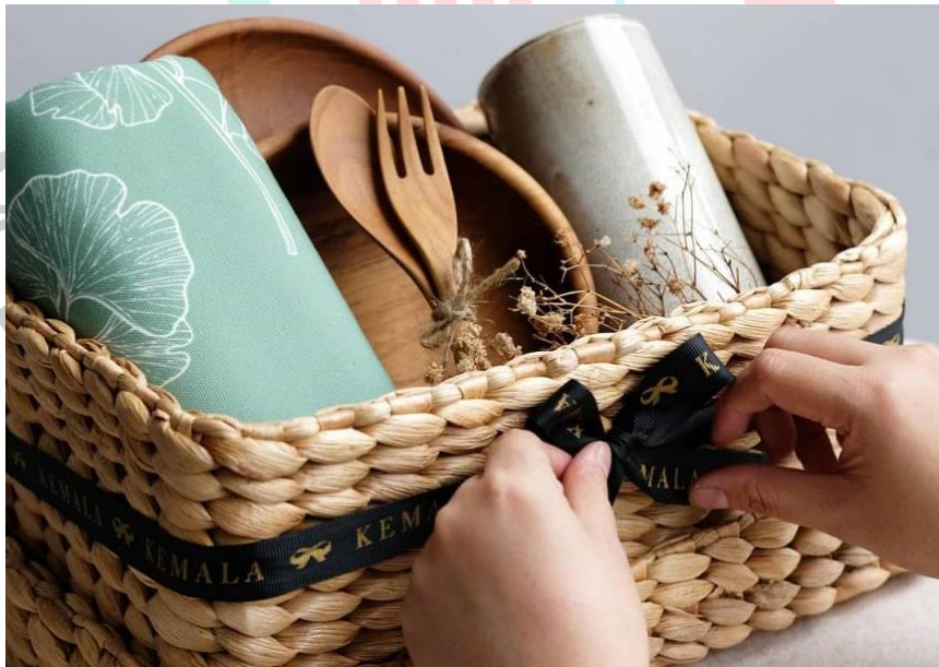
Gambar 2.15 Gift Hampers