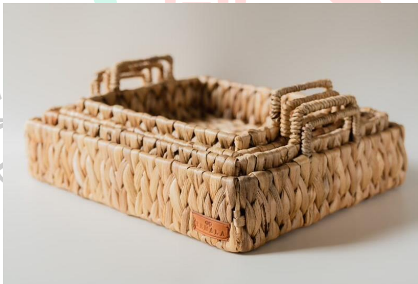
Gambar 2.7 Natural Fibre Basket