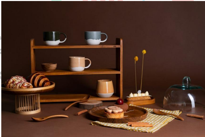
Gambar 2.9 Teak Shelf