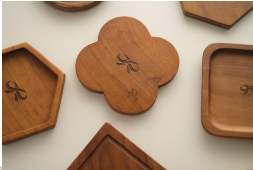
Gambar 2.6 Teak Coasters