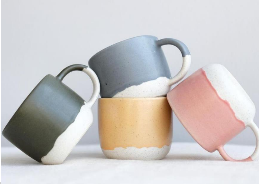
Gambar 2.12 Ceramic Mug