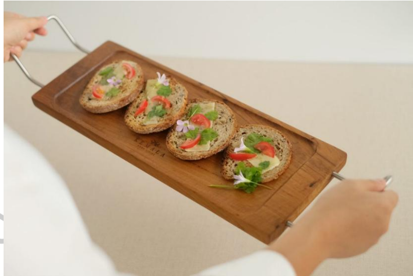
Gambar 2.4 Teak Tray With Stainless Handle

unggulan dari Kemala Home Living yang lainnya yaitu cangkir dan piring dengan material keramik, dan keranjang dengan material eceng gondok (Kemala.2021).