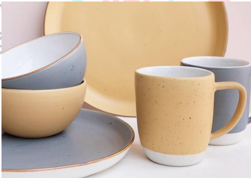
Gambar 2.13 Ceramic Mug & Plate