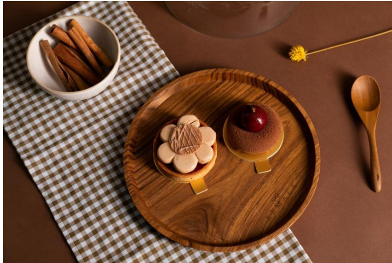
Gambar 2.8 Round Teak Plate 30cm