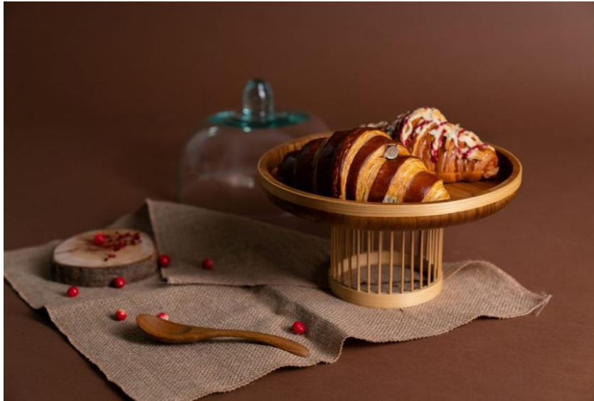
Gambar 2.10 Hampers