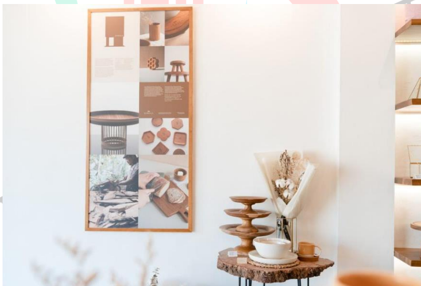
Gambar 2.3 Suasana Store Tempat Penulis Bekerja