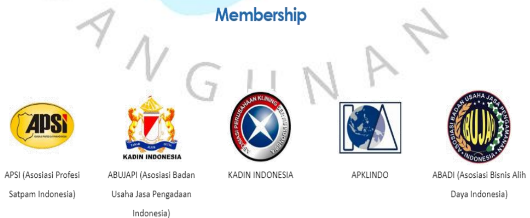
Gambar 2 3 Membership PKSS