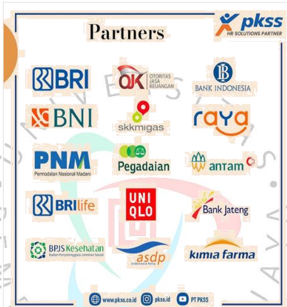
Gambar 2 4 Partners PKSS

Dalam perjalanannya selama 24 tahun, PKSS telah menjalin kerja sama dengan berbagai perusahaan nasional dan swasta. Bekerja sama dengan sekitar 300 mitra untuk memajukan tenaga kerja, PKSS selalu mengutamakan kepuasan pelanggan dan tetap menjadi perusahaan terbaik di Indonesia.