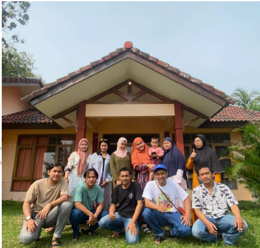
Gambar 2. 3 Foto Sebagian Staf PT Pendawa Anugrah Sakti Sejati