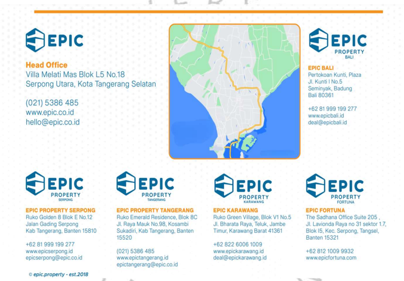
Gambar 2. 2 Kemitraan EPIC

saran yang jujur dan pengalaman terbaik. Dalam upayanya untuk memberikan layanan yang terbaik, EPIC mengintegrasikan inovasi dan pengetahuan industri terkini, memastikan bahwa klien mendapatkan solusi properti yang paling sesuai dengan kebutuhan mereka. Dari konsultasi awal hingga penyelesaian transaksi, EPIC mengutamakan pendekatan yang berorientasi pada klien, memastikan bahwa setiap aspek layanan disesuaikan untuk mencapai hasil yang optimal. Kesuksesan dan pertumbuhan EPIC selama bertahun-tahun ini merupakan bukti komitmen perusahaan terhadap keunggulan dalam industri properti, serta dedikasi untuk mempertahankan standar layanan yang tinggi dan hubungan klien yang kuat.