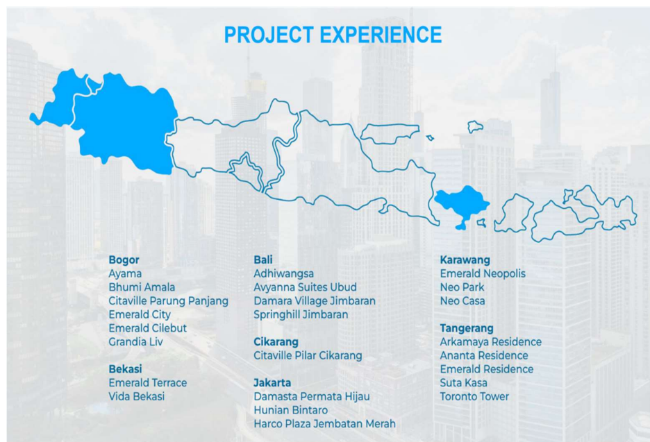
Gambar 2. 3 Project experience EPIC

mengelola berbagai proyek properti, tetapi juga menunjukkan kepercayaan yang tinggi dari klien dan mitra bisnis. Ekspansi ini juga mencerminkan visi dan strategi EPIC dalam menjangkau pasar yang lebih luas serta menyediakan solusi properti yang inovatif dan terintegrasi. Penghargaan yang diraih merupakan pengakuan atas standar layanan yang tinggi, inovasi, dan keberhasilan dalam memenuhi dan melebihi ekspektasi pelanggan. Kemajuan ini juga merupakan bukti dari adaptasi EPIC terhadap dinamika pasar dan komitmennya untuk terus berkembang sebagai pemimpin di industri properti.