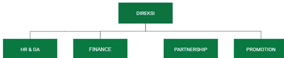
Gambar 2. 5 Struktur organisasi PT. EPIC

Berikut yaitu struktur organisasi PT. Epik Properti Indonesia: