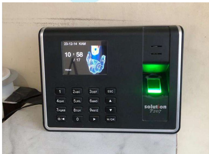
Gambar 2. 8 Absensi / Finger Print Karyawan EPIC