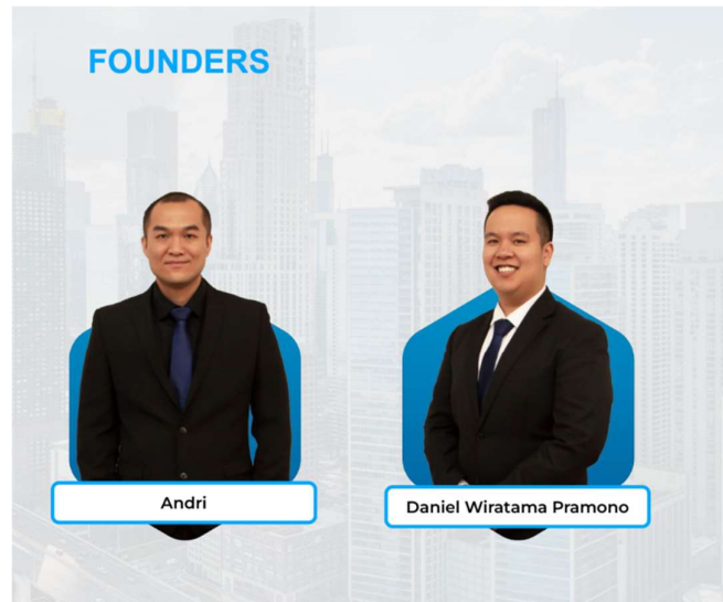
Gambar 2. 4 Direksi PT. EPIC

Berikut adalah pemilik PT. Epik Properti Indonesia