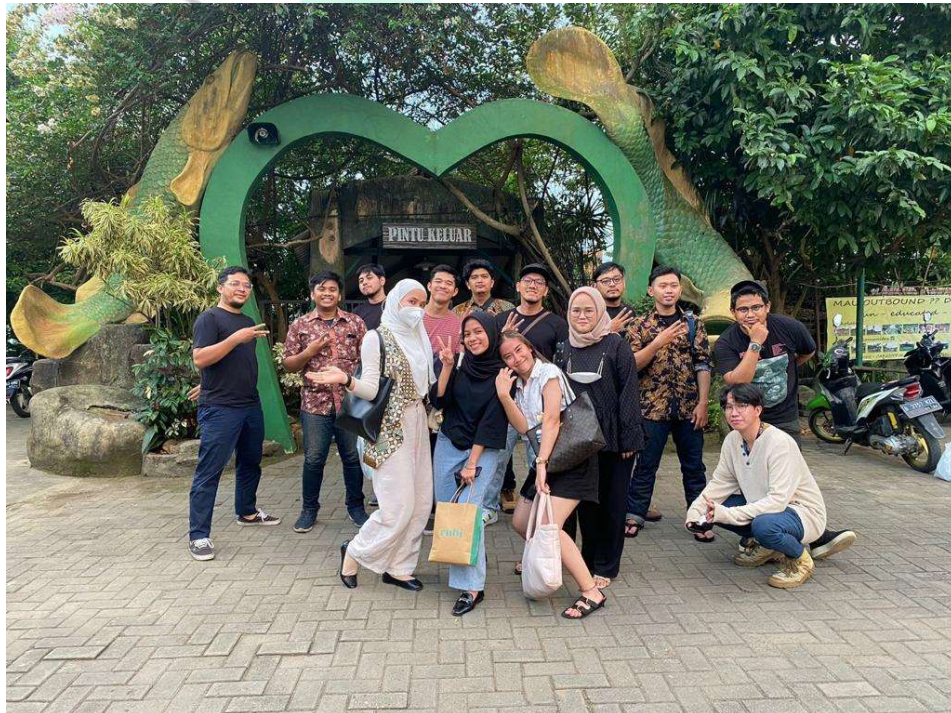
Gambar 2.7 Karyawan Divisi Human Resources & General Affairs pada kegiatan Gathering PT. EPIC

Tugas seorang Legal yaitu bertanggung jawab untuk mengelola semua aspek hukum perusahaan, termasuk memberi nasihat hukum, memastikan kepatuhan terhadap regulasi, dan menangani permasalahan hukum yang mungkin timbul. Sedangkan, seorang General Affairs bertanggung jawab untuk mengelola kebutuhan administratif dan fasilitas umum perusahaan, termasuk pengelolaan kantor, peralatan, dan inventaris kantor.