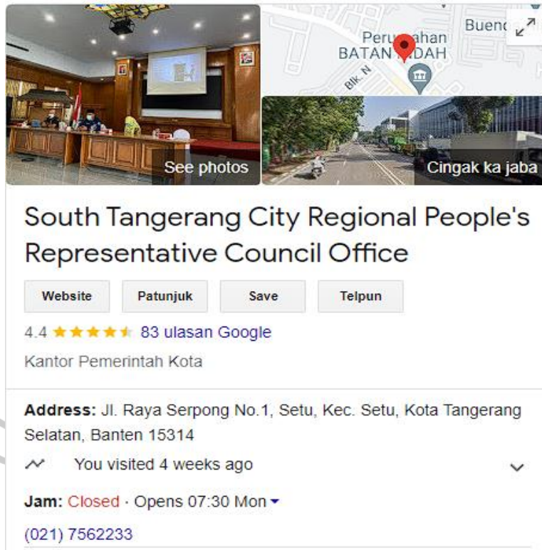
Gambar 1.1 Keterangan Lokasi Kantor Sekretariat DPRD Kota Tangerang Selatan