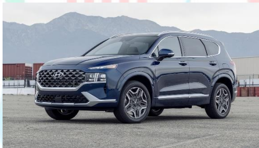
Gambar 2.8 Hyundai Santa Fe