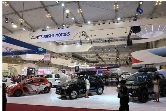
Gambar 2.9 GIIAS

kali diselenggarakan pada tahun 2016 di Jakarta International Expo, Kemayoran, Jakarta Pusat. Hyundai bersama PT Andalan Auto Prima selalu aktif mengikuti GIIAS di setiap tahunnya untuk mendorong visibilitas dan penjualan.