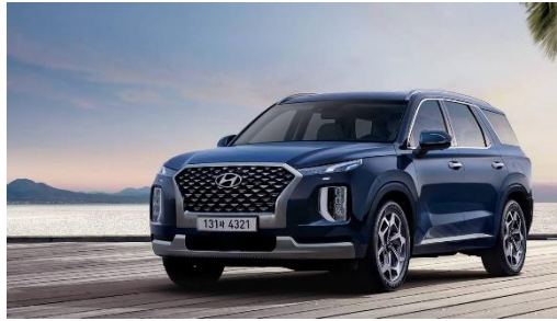
Gambar 2.7 Hyundai Palisade