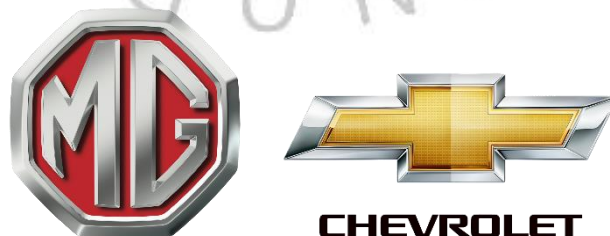
Gambar 2.1 Logo MG dan Chevrolet