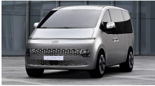
Gambar 2.5 Hyundai Staria