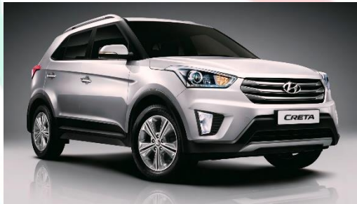
Gambar 2.6 Hyundai Creta