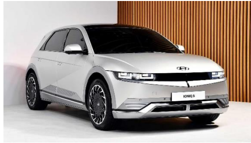
Gambar 2.3 Hyundai Ioniq 5