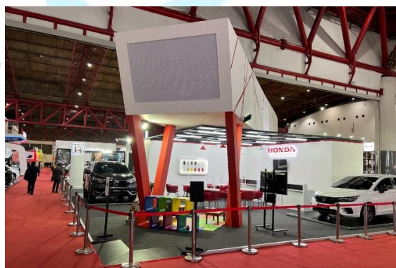
Gambar 2.10 Pekan Raya Jakarta

PRJ atau yang juga dikenal dengan Jakarta Fair , adalah pameran tahunan terbesar di Indonesia dan Asia Tenggara yang biasanya diselenggarakan selama bulan Juni hingga Juli dalam rangka memperingati hari jadi Ibukota Jakarta (Wikipedia, 2023). Pada rangkaian PRJ, terdapat pameran otomotif yang diikuti oleh berbagai merek. Hyundai pun juga turut berpartisipasi dalam pameran otomotif yang diselenggarakan PRJ.