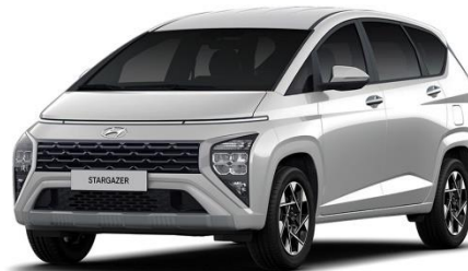
Gambar 2.4 Hyundai Stargazer

Stargazer adalah mobil MPV ( Multi-Purpose Vehicle ) terbaru milik Hyundai yang memiliki desain futuristik dan dinamis. Mobil ini dilengkapi dengan banyak sekali fitur yang menunjang kenyamanan dan perlindungan ketika berkendara, seperti Parking Censor , Hill-start Assist Control , Tire Pressure Monitoring System , dan fitur Drive Mode yang terdiri dari Normal , Eco , Sport , serta Smart Mode (Hyundai Mobil, 2023).