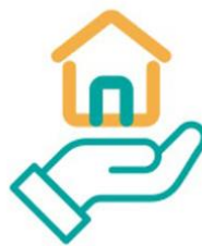
Gambar 2. 8 BSI Griya Hasanah