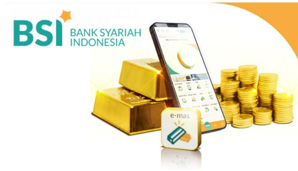
Gambar 2. 7 BSI Gadai Emas