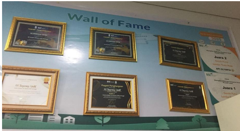
Gambar 2. 2 Wall of Fame Bank Syariah Indonesia KCP Tangerang Ciputat

Syariah Indonesia, Tbk KCP Tangerang Ciputat telah mencapai sejumlah penghargaan dan prestasi