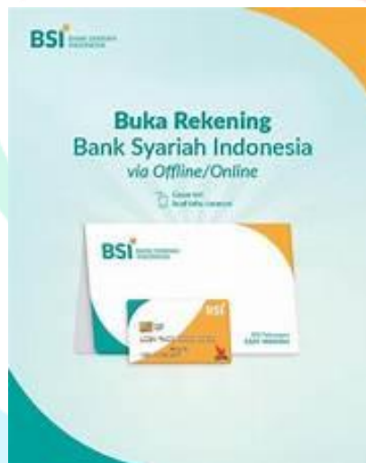
Gambar 2. 6 Buku Tabungan Syariah