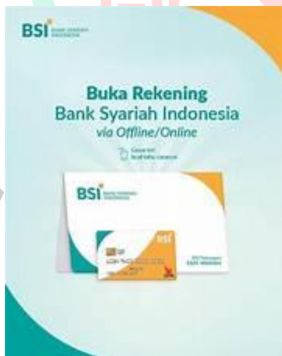
Gambar 2. 4 Buku Tabungan Syariah

Dalam rangka mendukung operasional PT. Bank Syariah Indonesia KCP Tangerang Ciputat, terdapat sejumlah produk dan layanan yang disajikan oleh bank tersebut.