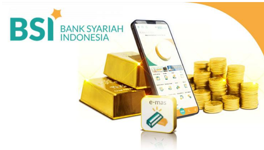
Gambar 2. 5 BSI Gadai Emas