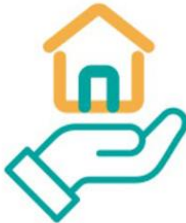
Gambar 2.6 BSI Griya Hasanah