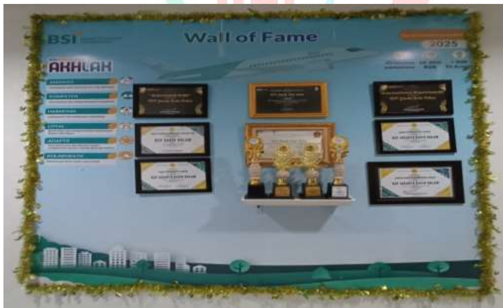
Gambar 2 2 Prestasi Perusahaan