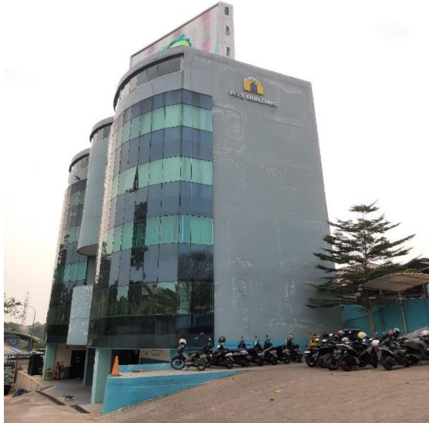
Gambar 1.1 Gedung PT Pembangunan Investasi Tangerang Selatan