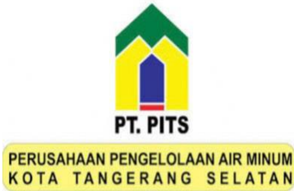
Gambar 2.1 Logo PT. PITS