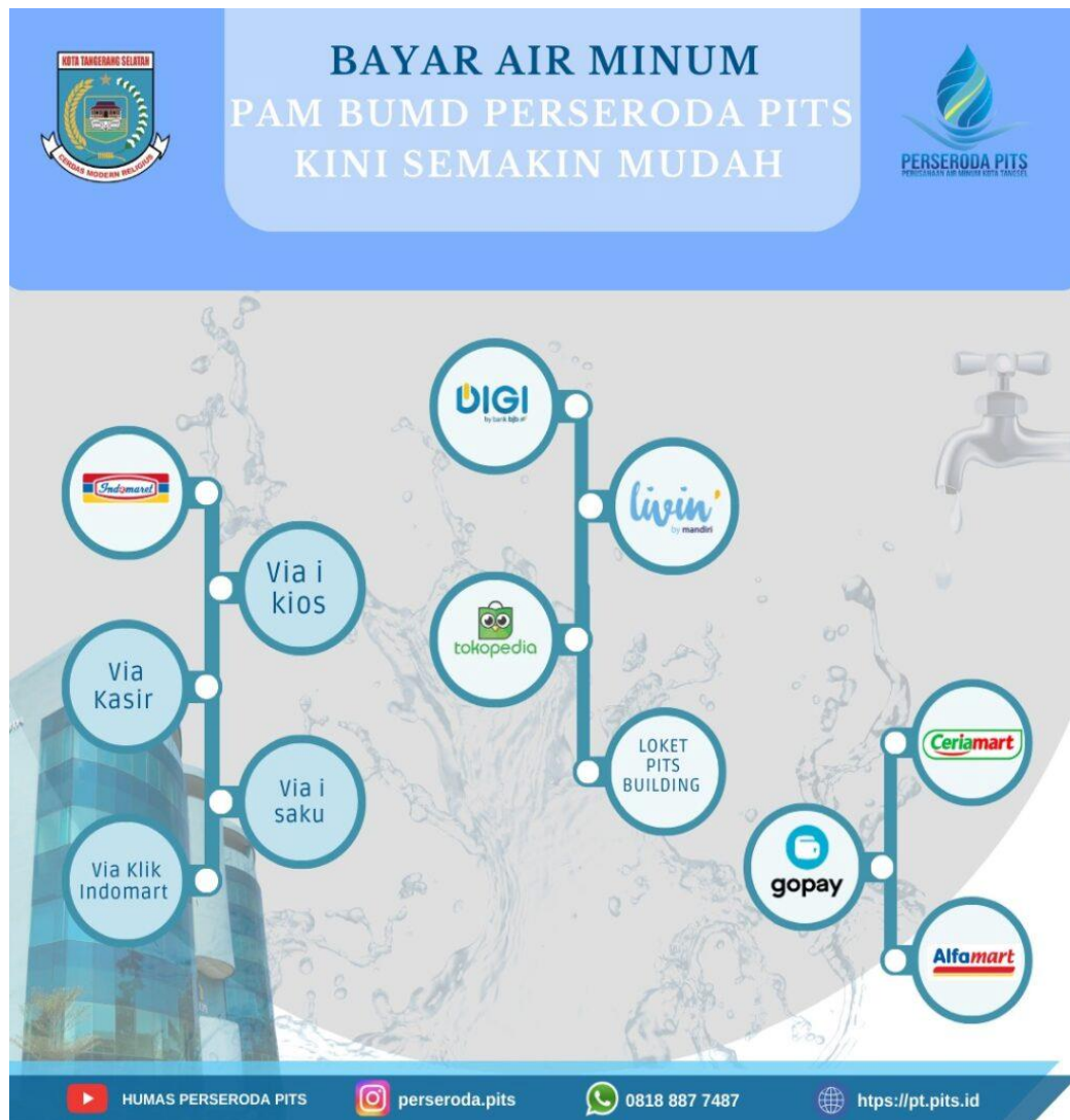
Gambar 2.3 Cara Pembayaran

rumah pelanggan tersebut serta akan dilakukan instalasi meter tersebut akan di cabut.