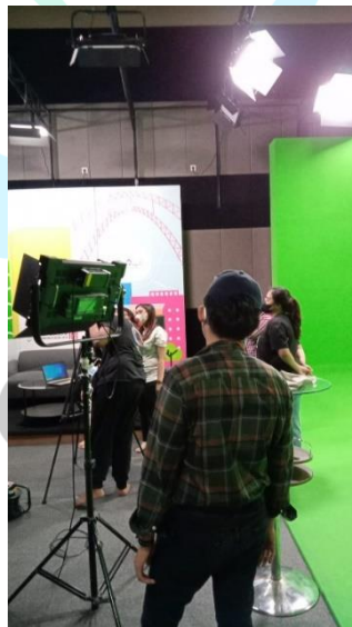
Gambar 3. 2 Floor Director