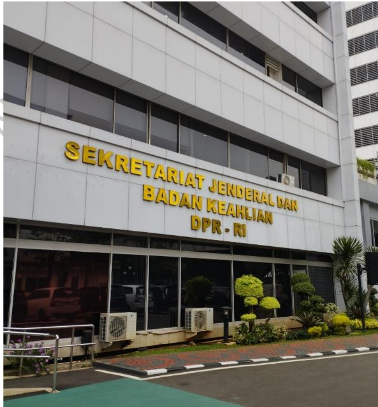
Gambar 1.1 Gedung Sekretariat Jenderal DPR RI