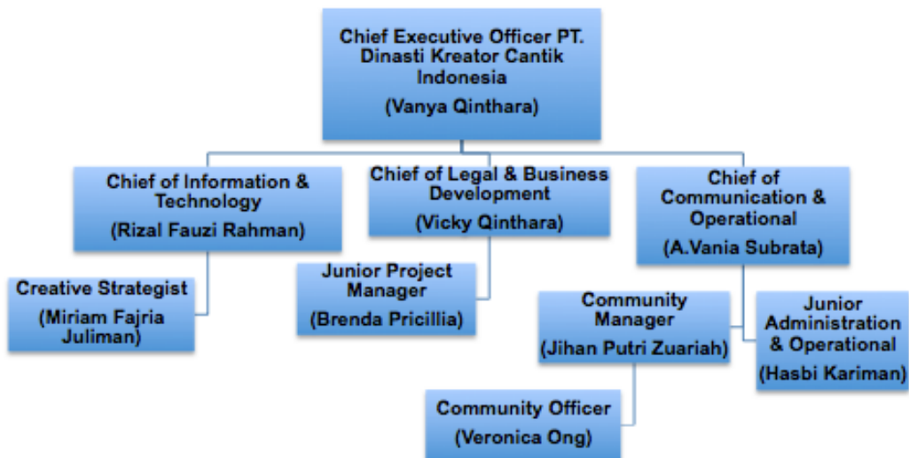
Gambar 2. 3 Struktur Organisasi PT. Dinasti Kreator Cantik Indonesia