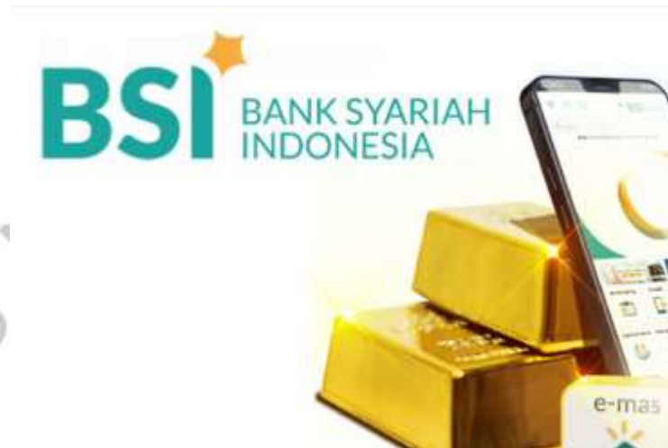
Gambar 2. 8 Produk BSI Cicil Emas