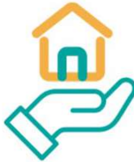
Gambar 2. 9 Produk BSI Griya Hasanah