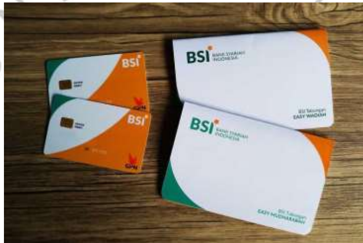
Gambar 2. 5 Produk BSI Tabungan easy wadiah dan easy mudharabah