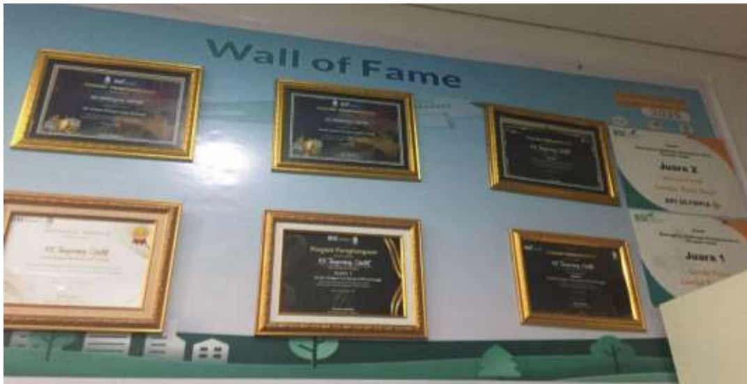
Gambar 2. 3 Wall Of Fame Bank Syariah Indonesia Kcp Tangerang Ciputat