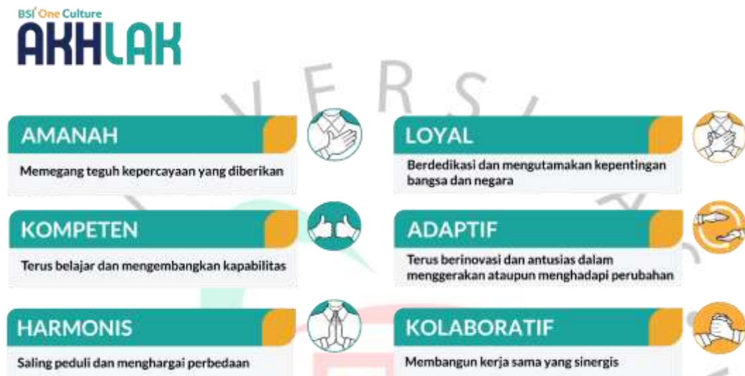
Gambar 2. 2 Nilai - Nilai Perusahaan

Pada perusahaan Bank Syariah Indonesia menerapkan Core Values yang memiliki enam nilai inti yang mencerminkan pencapaian perusahaan selama bertahun-tahun dan keyakinan masyarakat terhadapnya sejak didirikan. Dari saat pendirian hingga saat ini, BSI memiliki enam nilai utama, yaitu: