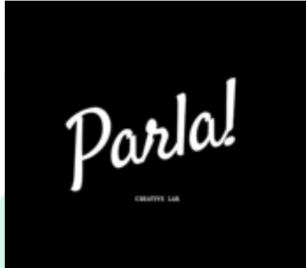
Gambar 2.1 Logo Parla Inc Agency