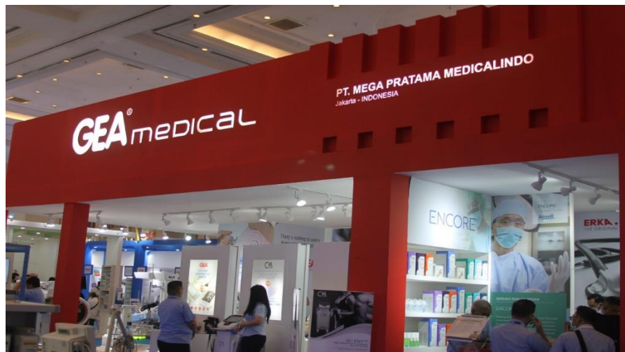
Gambar 2. 2 Pameran PT. Mega Pratama Medicalindo