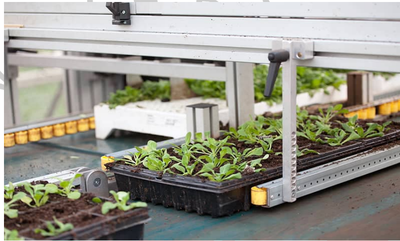
Gambar 2.3 Penampian Bibit

Dengan penampian bibit milik mereka, para petani bisa menghasilkan akar optimal dengan menggunakan material yang tahan lama. Penampian bibit ditampilkan pada gambar 2.4.