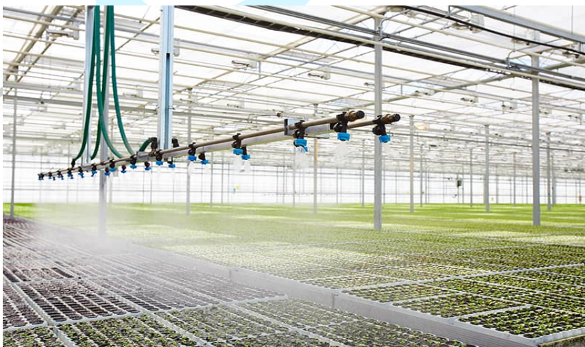
Gambar 2.2 Rumah Kaca

Perusahaan ini menyediakan rumah kaca berkualitas serta aksesoris yang didesain khusus untuk iklim dan keadaan di Indonesia. Rumah kaca ditampilkan pada gambar 2.3.