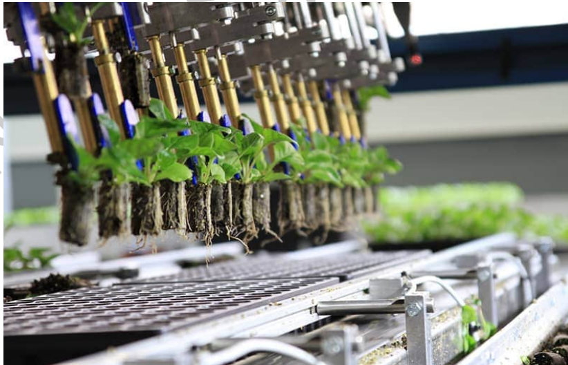
Gambar 2.1 Ellepot

Ellepot merupakan system persemaian yang terintegrasi. Sistem ini akan mengurangi penggunaan plastik sekali pakai dalam persemaian. Ellepot ditampilkan pada gambar 2.2.