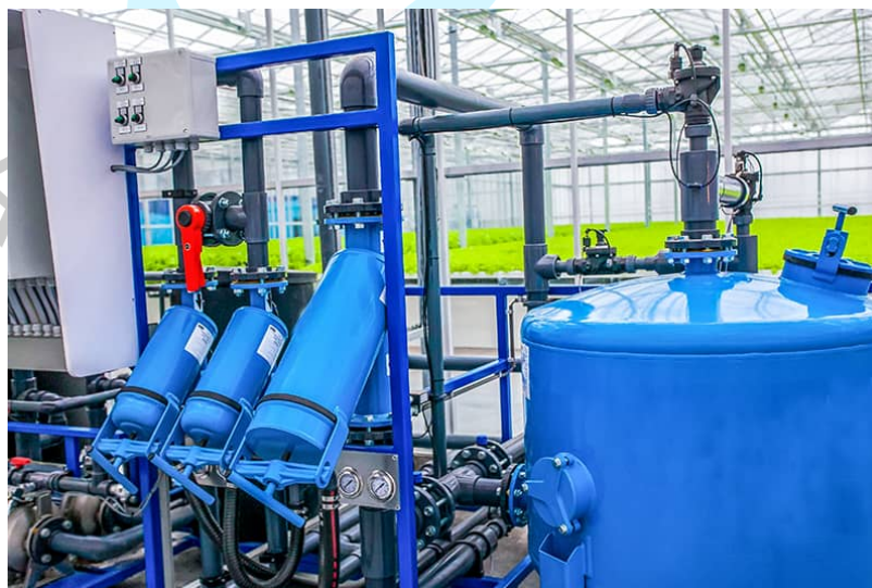
Gambar 2.4 Irigasi

Irigasi adalah faktor penting untuk bisa menghasilkan tanaman yang optimal. Dibutuhkan irigasi dan fertigasi yang efektif dan konsisten dengan alat yang sesuai. Irigasi ditampilkan pada gambar 2.5.