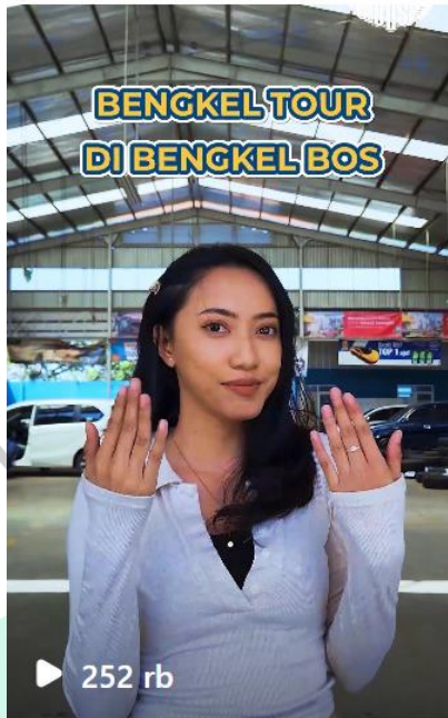
Gambar 3.6 Content Video