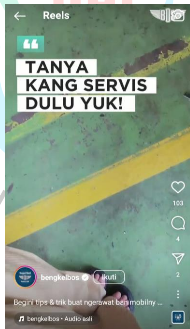
Gambar 3.7 Content Video