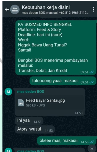
Gambar 3. 4 Menginformasikan Content

menyiapkan script . Berikut dari divisi social media & content menginformasikan ke divisi design graphic .