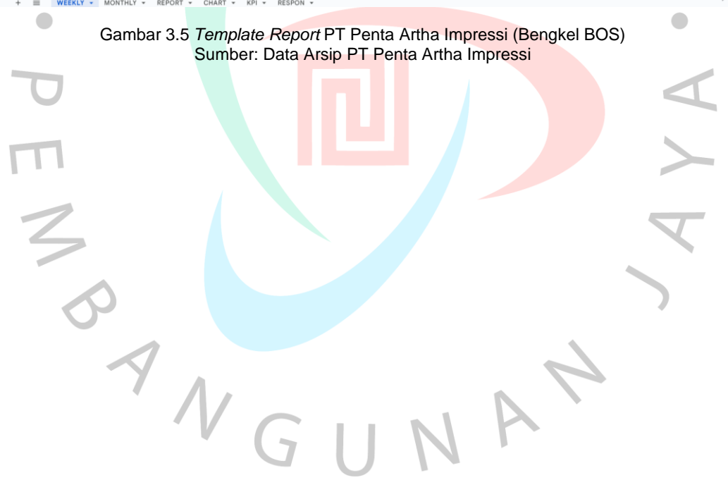
Gambar 3.5 Template Report PT Penta Artha Impresi (Bengkel BOS)