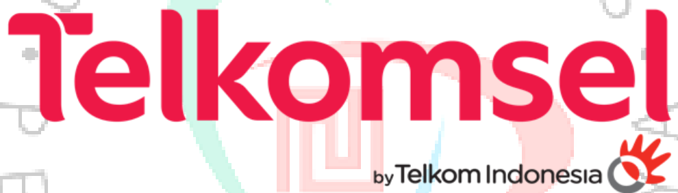
Gambar 2.1 Logo Telkomsel

PT Telekomunikasi Seluler Indonesia, yang dikenal sebagai Telkomsel, adalah perusahaan telekomunikasi yang berbasis di Jakarta, Indonesia. Telkomsel didirikan pada tahun 1995 sebagai anak perusahaan dari PT Telekomunikasi Indonesia Tbk, yang merupakan salah satu Perusahaan telekomunikasi terbesar di Indonesia. Perjalanan Telkomsel dimulai dengan perilisan layanan pascabayar pada tanggal 26 Mei 1995. Pada bulan November 1997, Telkomsel mencatatkan prestasi sebagai operator telekomunikasi seluler pertama di Asia yang memperkenalkan layanan isi ulang GSM pra-bayar. Keberhasilan ini membawa inovasi dalam industri telekomunikasi di Indonesia.