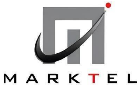
Gambar 2. 1 Logo PT. Manunggaling Rizki Karyatama Telnics