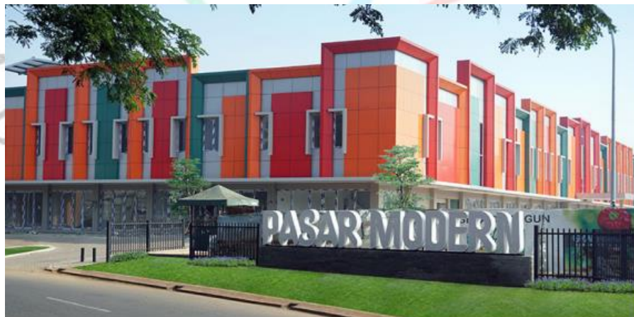
Gambar 2.1 Gedung Pasar Modern Graha Raya

PT Sumber Jaya Kelola Indonesia merupakan perusahaan pengembang dan pengelola property. Perusahaan PT Sumber Jaya Kelola Indonesia ini berdiri pada tahun 1979 yang merupakan salah satu anak perusahaan PT Pembangunan Jaya. PT Pembangunan Jaya memegang kendali PT Sumber Jaya Kelola Indonesia dan PT Jaya Real Property Tbk. sejak berdirinya PT Sumber Jaya Kelola Indonesia telah mempelopori pengembangan property pada kawasan pemukiman di wilayah Jakarta, yakni menawarkan rumah berkualitas di lingkungan yang menarik disemua sektor, selain itu PT Sumber Jaya Kelola Indonesia juga membangun banyak unit sebagai pusat perbelanjaan dan lainnya. PT Sumber Jaya Kelola Indonesia didirikan untuk menunjang kegiatan operasional PT Jaya Real Property Tbk.