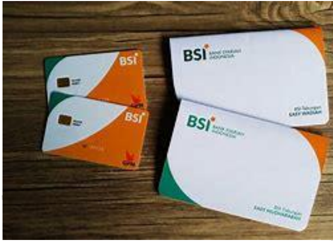
Gambar 2. 4 Buku Tabungan Syariah