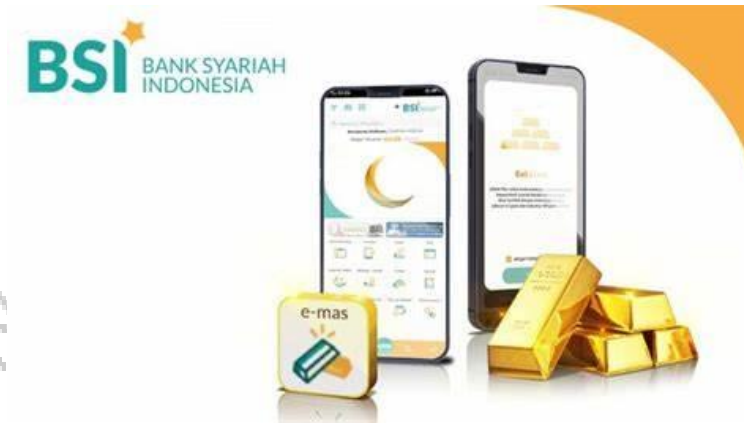
Gambar 2. 6 BSI Cicil Emas

Sumber: Bank Syariah Indonesia. BSI Cicil Emas