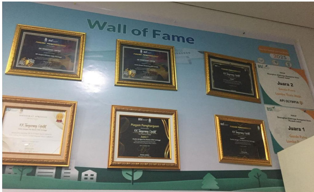
Gambar 2. 2 Prestasi Perusahaan