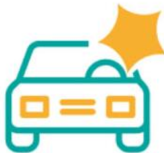
Gambar 2. 8 BSI OTO