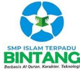
Gambar 2.1 Logo SMPIT Bintang