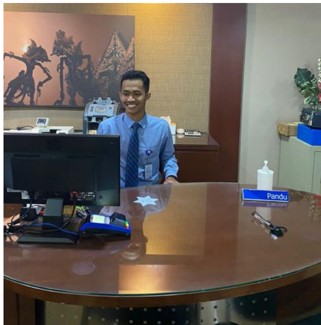
Lampiran 2. 1 Praktikan Saat Melakukan Kerja Profesi