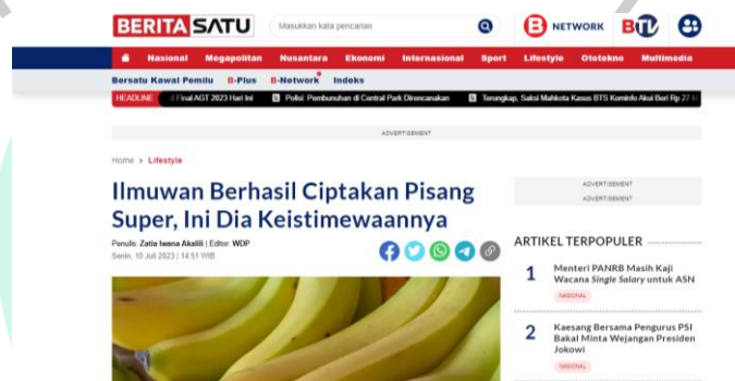
Gambar 3. 4 Contoh Menerjemahkan Artikel

Berikut adalah beberapa contoh hasil artikel terjemahan website luar negeri yang praktikan tulis. Artikel pertama berasal dari Odditycentral dengan judul “ Scientists Create ‘Superbanana’ That Could Save Millions of Lives, ” yang akhirnya praktikan terjemahkan menjadi “Ilmuwan Berhasil Ciptakan Pisang Super, Ini Dia Keistimewaannya.” Artikel kedua berasal dari Soranews24 dengan judul “ Cruising Around Gunkanjima, Japan’s otherworldly ‘ Battleship Island’, ” yang diterjemahkan oleh praktikan menjadi “Berlayar ke Gunkanjima Jepang, Pulau Tak Berpenghuni.”