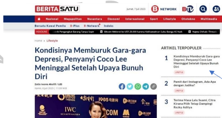
Gambar 3. 1 Contoh Artikel Terpopuler

Setelah artikel mengenai Coco Lee ini diunggah, praktikan mendapatkan pujian dari editor rubrik Internasional karena jumlah pembaca yang cukup banyak. Selain itu, artikel ini masuk ke dalam pencarian artikel terpopuler di Beritasatu.com. Artikel terpopuler ini juga dapat diartikan sebagai artikel yang paling banyak dibaca dan dicari saat itu.