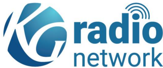
Gambar 2. 1 Logo KG Radio Network