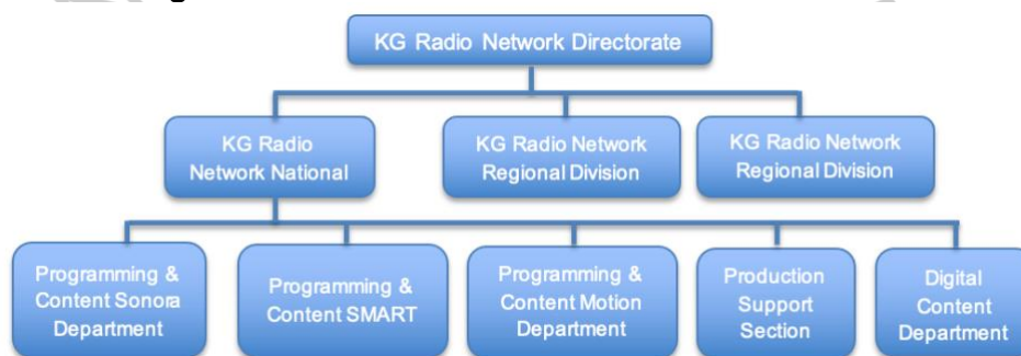
Gambar 2. 2 Struktur Organisasi KG Radio Network