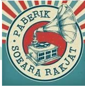
Gambar 2. 1 Logo Paberik Soeara Rakjat