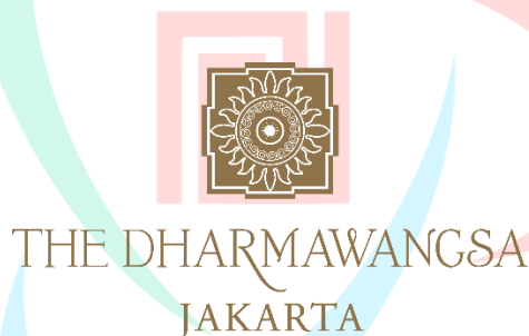
Gambar 2.1 Logo The Dharmawangsa Jakarta

Logo The Dharmawangsa Jakarta terinspirasi dari lambang kerajaan Majapahit pada abad ke-14 yang dikenal dengan Surya Majapahit. Logo tersebut melambangkan surya atau matahari yang memiliki makna dewa-dewa Hindu dengan sinarnya yang mengarah ke berbagai arah mata angin (Timur, 2014). Pada bagian tengah logo terdapat lambang bulan dengan cahayanya yang memiliki arti pantulan cahaya matahari. Cahaya bulan yang dapat menyinari bumi pada malam hari merupakan hasil dari pantulan sinar matahari yang sedang menyinari bumi bagian pada bagian lain (Muharram, 2021). Logo "Surya Majapahit" terdapat di berbagai sisi ruangan hotel hal tersebut memiliki makna bahwa seluruh bagian hotel akan terkena sinar matahari dan bulan yang tiada redupnya.