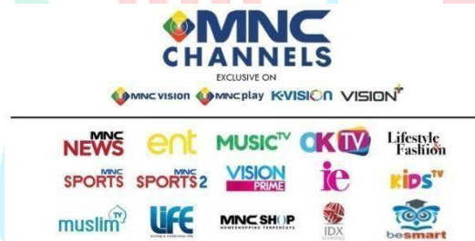
Gambar 2.4. Unit Program MNC CHANNELS (Dokumen Perusahaan)

MNC Channels didirikan pada tanggal 1 Maret 2006 yang memiliki beberapa jenis platform, yaitu MNC Play, Vision+, Playbox, serta K-Vision. MNC Channels adalah salah satu bawahan MNC Media yang memiliki visi untuk menjadi sebuah pilihan pertama pada keluarga dalam menayangkan konten televisi yang bermanfaat dan menarik.