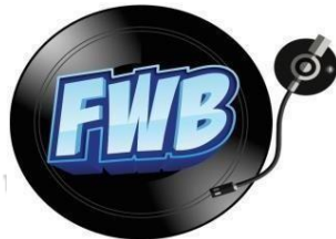
Gambar 2.6. Logo Friends With Benefit (Dokumen Perusahaan)

memiliki target audiens yaitu kaum milenial yang dinamis dan kekinian. Music TV memiliki departemen sendiri untuk mengelola operasi perusahaan. Di Departemen Music TV, praktikan posisi praktikan sebagai Social Media Specialist .