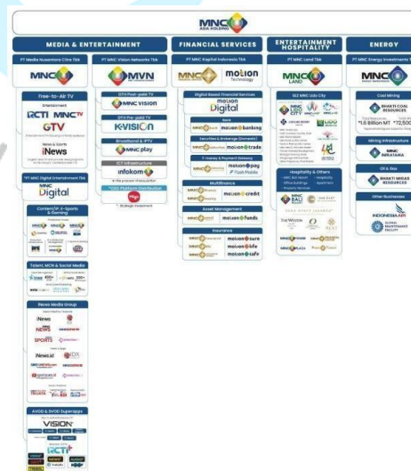
Gambar 2.2. Struktur Perusahaan MNC Group

MNC Group adalah sebuah media yang didirikan pada 2 November 1989 yang merupakan jenis grup bisnis dalam bidang media terbesar yang ada di Indonesia (mncgroup.com, 2023). Pada awal perusahaan ini dibangun didirikan di Surabaya dan dipindahkan di Ibukota Jakarta pada tahun 1990. Perusahaan ini didirikan oleh pendiri dan Executive Chariman, yaitu Hary Tanoesoedibjo yang merupakan kepemimpinan dari MNC Group.