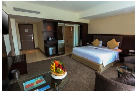
Gambar 2.5 Kamar Tipe Deluxe