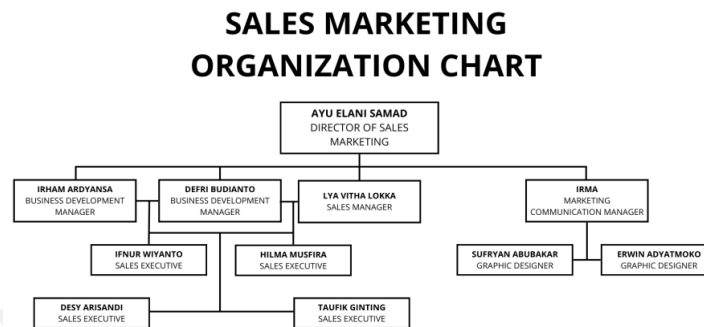
Gambar 2.4 Sales Marketing Organization Chart

Pada Sales & Marketing Departement (SM) sebagai departement tempat praktikan melakukan kegiatan magang, terdapat beberapa jobdesk yang menjadi dasar pekerjaan bagi tim SM dalam menjalankan tugas dan tanggung jawab sebagai tenaga kerja di PT. Fajar Phinisi Seaside khususnya pada Claro Hotel Kendari, sebagai berikut: