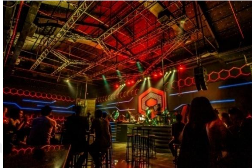
Gambar 2.8 D'Liquid

Millena Spa terletak di gedung yang sama pada lantai dasar sebagai tempat relaksasi bagi para pria ketika sedang merasa penat. Berbagai fasilitas dan pelayanan disediakan Millena Spa mulai dari Spa, Massage, Sauna dan juga Gym menjadikan Millena Spa sebagai tempat bersantai yang menenangkan ketika sedang merasa penat dan lelah. Millena Spa melengkapi Entertainment yang dimiliki Claro Hotel Kendari mulai dari tempat untuk bersuka ria sampai dengan tempat untuk relaksasi.