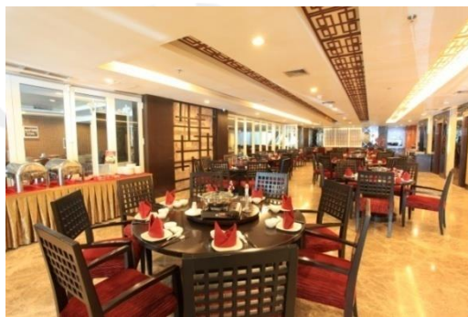
Gambar 2.7 Sunachi Suki & Resto

Sky Lounge & Bar terletak di lantai 15 gedung A Claro Hotel Kendari memiliki pemandangan Kota Kendari yang sangat indah Sky Lounge & Bar menawarkan berbagai macam paket mulai dari Romantic Dinner sampai dengan paket meeting yang dapat dipesan oleh pengunjung untuk berkunjung ke tempat ini. Selain itu, pengunjung juga dapat bersantai di tempat ini karena menu yang disajikan cukup bervariasi dan setiap malam juga terdapat live music yang akan memberikan nuansa yang tenang bagi pengunjung ketika berada di Sky Lounge & Bar. Tempat ini buka mulai pukul 10.00 AM – 22.00 PM WITA.