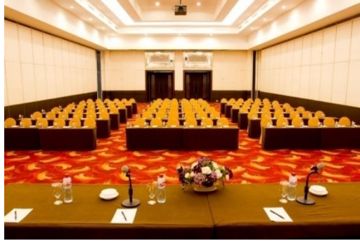
Gambar 2.6 Phinisi Ballroom