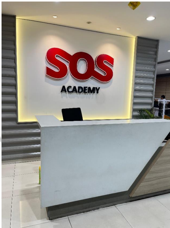
Gambar 1. 2 Area Lobby Perusahaan