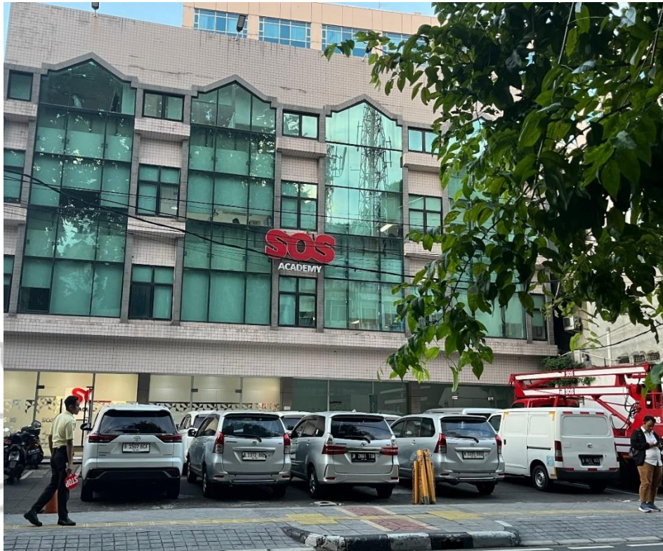
Gambar 1. 1 Lokasi Praktikan Melaksanakan Kerja Profesi

Tempat praktikan melaksanakan Kerja Profesi yaitu di PT SOS Indonesia yang beralamat Jl. Tanah Abang II No.2A, RT.1/RW.8, Petojo Sel., Kecamatan Gambir, Kota Jakarta Pusat, Daerah Khusus Ibukota Jakarta 10160.