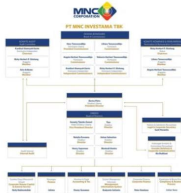
Gambar 2.2 struktur organisasi mnc group