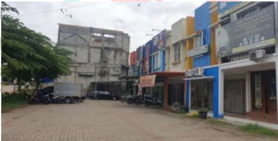
Gambar 1. 1 Ruko Puri Bintaro Indah PT.Mukrindo Berkah Aditama