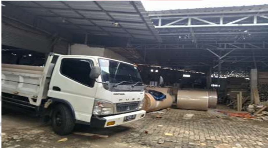
Gambar 1. 3 gudang produksi