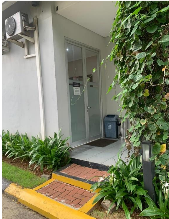
Gambar 1.1 Kantor Pengelola Apartemen Emerald Bintaro