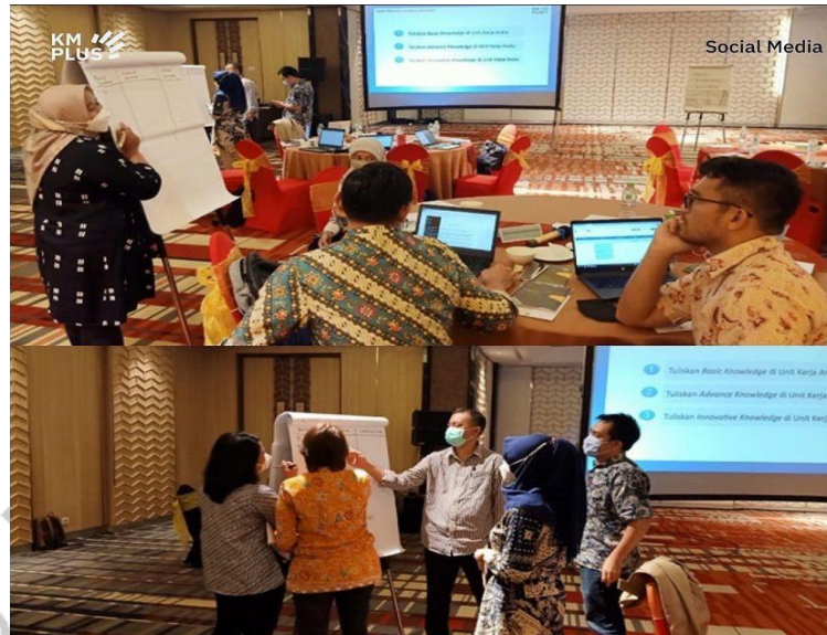
gambar 2. 4 workshop bersama klien