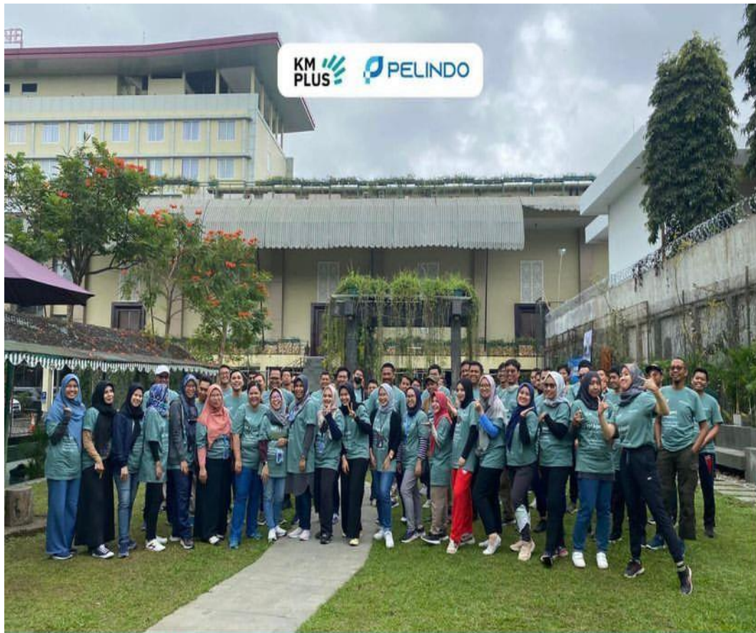
gambar 2. 7 gathering dengan klien