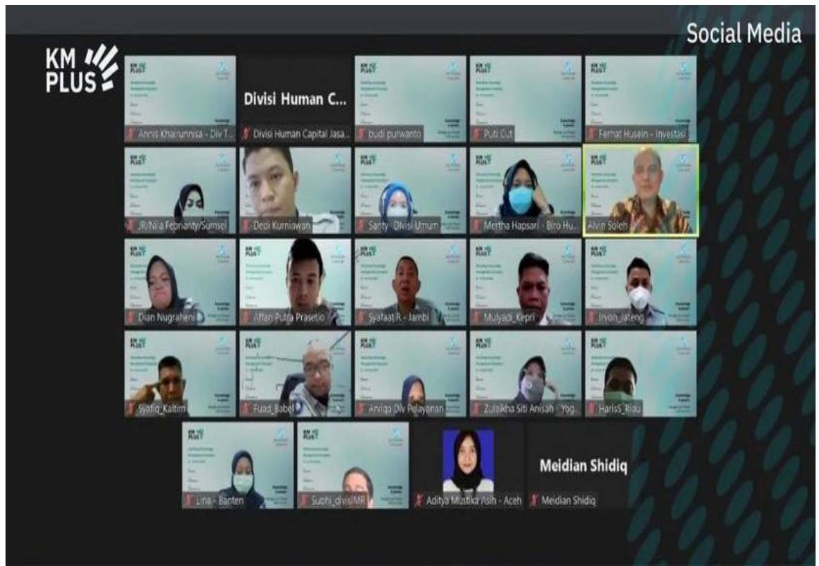
gambar 2. 5 zoom bersama PT. Pelindo