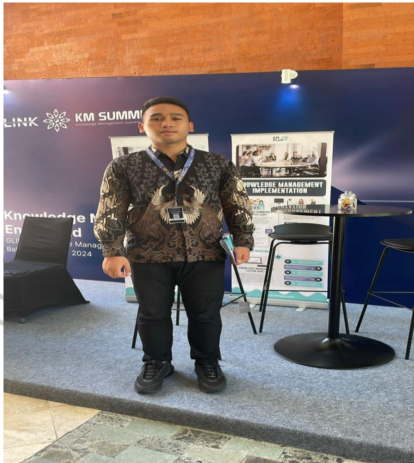
gambar 2. 6 booth workshop KMPlus