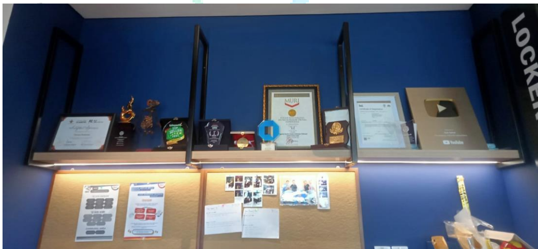
Gambar 2.2 Dokumentasi Prestasi dan Penghargaan perusahaan