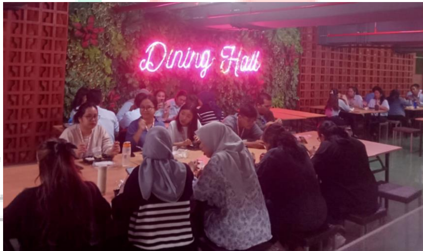
Gambar 2.11 Suasana saat makan siang di DH

Praktikan sendiri melakukan kerja profesi (KP) pada departemen HR ( human resource ) di bagian GA ( general affairs ). Untuk kegiatannya sendiri perusahaan menerapkan sistem kerja hybrid yaitu karyawan dapat melakukan WFO ( work from office ) dan WFH ( work from home ). Untuk WFO sendiri tiap pilar diberikan jadwal untuk kapan harus masuk dan bekerja dari kantor. Masing-masing tim bekerja sesuai dengan porsi dan juga target KPI ( key performance indicator ) nya masing-masing yang harus dicapai. Saat pada waktu istirahat karyawan yang WFO di berikan fasilitas makan gratis yang bisa diambil di DH ( dinner hall ). Itu merupakan gambaran umum kegiatan dan pekerjaan umum yang dilakukan oleh perusahaan.