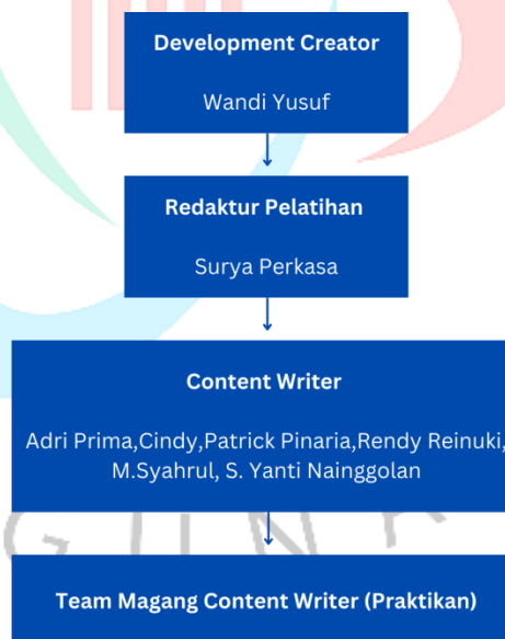
Tabel 2. 3 Struktur Divisi Content Development Medcom.id