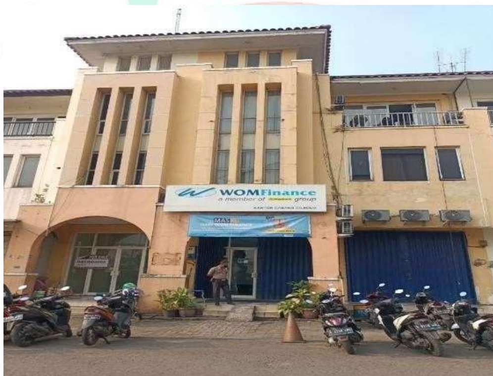
Gambar 1.2 Foto kantor Cabang WOM Finance Ciledug

Praktikum melaksanakan Kerja Profesi yang dimulai pada kegiatan belajar di semester akhir yaitu pada bulan Januari 2024 untuk mulai mempersiapkan diri melakukan kerja profesi dan beberapa dokumen lampiran yang diperlukan untuk memulai melaksanakan tugas Kerja Profesi.