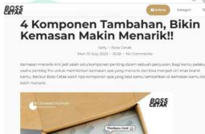
Gambar 3.2 Artikel Boss Cetak

Selain memperhatikan aspek kreatif dalam penulisan, praktikan juga memiliki tanggung jawab untuk memastikan bahwa konten yang dihasilkan memenuhi standar kualitas yang ditetapkan. Hal ini mencakup pengecekan dan perbaikan kata-kata yang digunakan, serta memastikan bahwa pesan yang disampaikan sesuai dengan strategi pemasaran dan branding perusahaan. Dengan demikian, praktikan berperan penting dalam menciptakan konten yang memikat dan persuasif untuk menarik perhatian audiens dan mencapai tujuan pemasaran yang ditetapkan oleh perusahaan. Salah satu artikel yang sudah di publish :