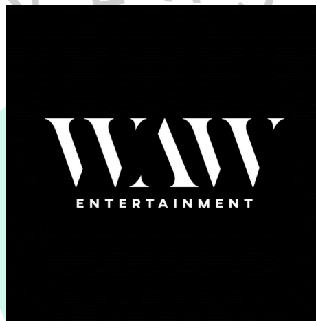
Gambar 2.1 Logo PH WAW Entertainment

PH WAW Entertainment didirikan oleh Wawan Datu selaku owner. Awalnya merupakan perusahaan ini memproduksi video hiburan untuk Youtube. Sebelumnya pada tahun 2021, Youtube ini bermula hanya memproduksi video podcast yang hanya sekedar berbincang bersama narasumber. Namun, setelah berjalannya 1 tahun, konten dan ide-idenya berubah yang tadinya monoton hanya bincang-bincang podcast menjadi tayangan hiburan dan mengkombinasikan podcast, informasi dan games. Perubahan konten ini dikarenakan permintaan terbanyak dari subscriber sehingga pada 2022 PH WAW Entertainment menambah beberapa konten dan berinovasi. PH. WAW Entertainment juga dilatar belakangi oleh meningkatnya antusias anak muda khususnya remaja terhadap berita-berita yang sedang viral.