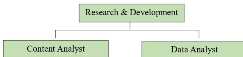
Gambar 2. 3 Struktur Organisasi Research & Development di MNC Channels