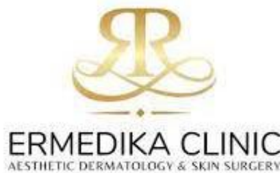
Gambar 2.1 Logo Ermedika Clinic

Ermedika Clinic adalah salah satu klinik kecantikan yang bergerak dalam pelayanan Aesthetic Dermatology & Skin Surgery . Ermedika Clinic memiliki berbagai jenis pelayanan yaitu; layanan Konsultasi Dokter Spesialis Kulit & Kelamin, bersifat Rawat Jalan, Facial Medis, Chemical Peeling, Laser and Light Based Device Treatment, Injectable Treatment ( Botox, Filler, Mesotherapy, Threadlift ), Intimate Area Treatment , Bedah Listrik / Elektrokauter , Bedah Kulit Minor , Vaksinasi HPV 1 , Telemedicine , Penjualan Produk Perawatan Kulit dan layman treatment lainnya. Ermedika Clinic menyiapkan berbagai sarana dan prasarana termasuk kompetensi sumber daya manusia yang profesional dan kompeten. Ermedika Clinic memiliki banyak variasi treatment yang tentunya bersifat Evidence Based Medicine . Fokus layanan kami adalah Dermatologi Estetik dan Bedah Kulit. Terbatasnya jumlah Klinik Utama Spesialis Kulit yang fokus dalam bidang tersebut membuat kami dikenal hingga ke luar kota Tangerang Selatan bahkan luar Pulau Jawa. Selain itu kami juga melayani treatment untuk area intim yang masih sulit ditemukan di klinik serupa. Dalam aspek harga semua mesin dan bahan baku yang digunakan di Ermedika Clinic sudah melalui seleksi oleh dr. Frien Refla, Sp.KK berdasarkan keilmuannya sebagai Dokter Spesialis Kulit dan Kelamin. Dengan kualitas bahan baku yang bermutu, harga treatment kami sangat kompetitif jika dibandingkan dengan klinik estetik lainnya.