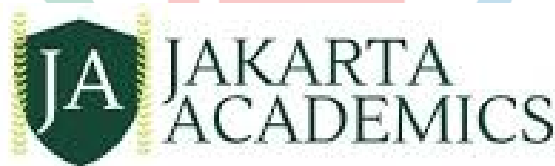
Gambar 2.1 Logo Jakarta Academics Sumber: Jakarta Academics