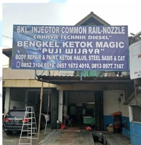
Gambar 2. 2 Kantor dan Workshop CV Cahaya Teknik Diesel

Pada awalnya Cahaya Teknik Diesel menyediakan 6 tenaga mekanik yang telah melalui program pelatihan dengan skill yang memadai