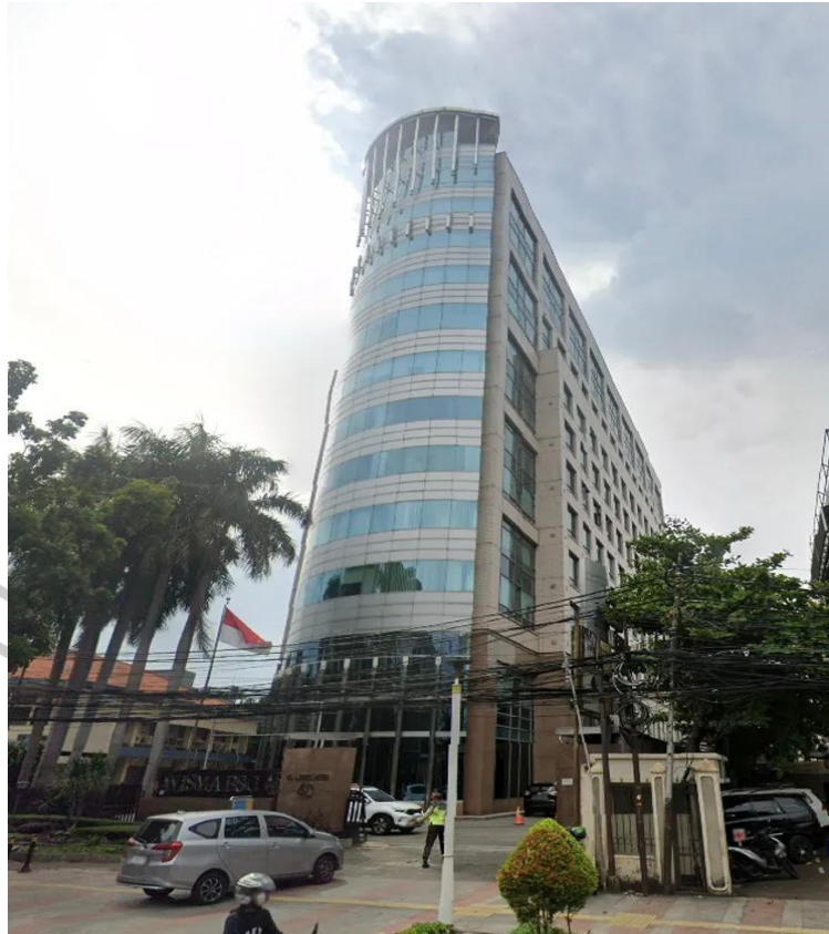
Gambar 1.1 Kantor PT. Vitech Asia