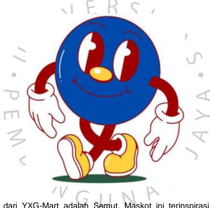
Maskot PT. YXG

Maskot dari YXG-Mart adalah Semut, Maskot ini terinspirasi dari Binatang Semut dikenal sebagai makhluk yang rajin dan bekerja keras. Dalam bisnis retail, filosofi semut mengajarkan pentingnya bekerja keras dan bekerjasama untuk mencapai tujuan bersama. Meskipun ukurannya kecil, semut memiliki kekuatan luar biasa dalam jumlah yang banyak. Ini mencerminkan bagaimana dalam bisnis retail, setiap pelanggan atau karyawan dapat memiliki pengaruh yang signifikan saat bekerja bersama. Semut memiliki struktur sosial yang terorganisasi dengan baik. Ini mengingatkan bisnis retail untuk memiliki struktur organisasi yang efisien dan terorganisasi agar dapat berjalan dengan baik. Semut sering bekerja dalam