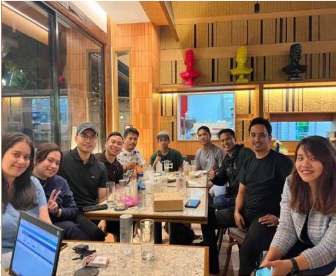
Lampiran. 1 Bukti Wawancara Stackholder